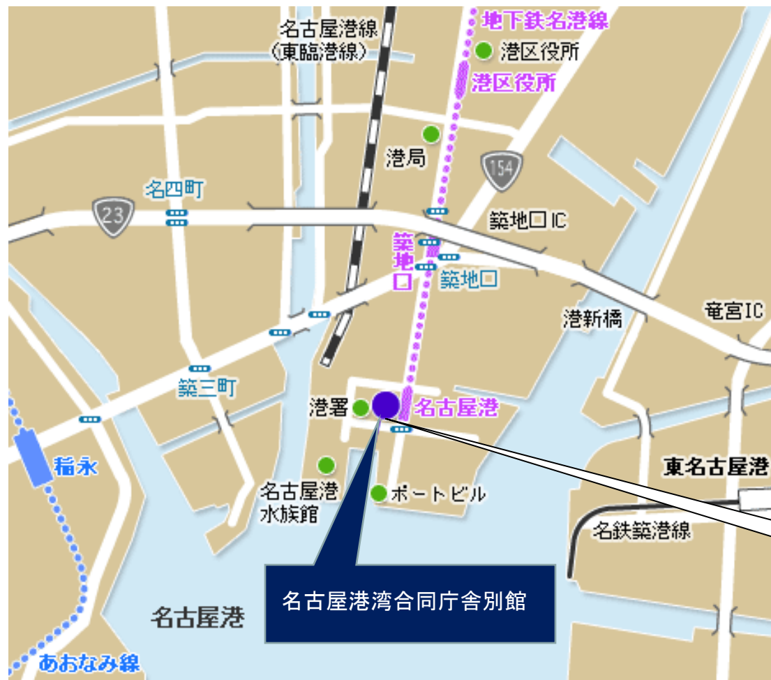
(参考)名古屋市営地下鉄路線図