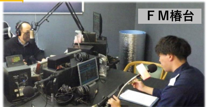
F M 椿台